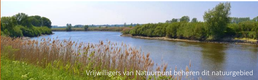
Vrijwilligers van Natuurpunt beheren dit natuurgebied

Vzw Camino zet zich naast het organiseren van maandelijkse groepswandelingen voor haar leden ook in voor het realiseren van permanent bewegwijzerde rolstoelvriendelijke routes in heel Vlaanderen.