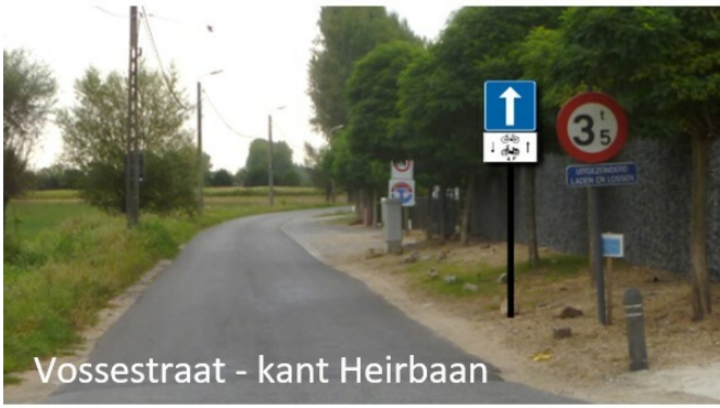
Vossestraat - kant Heirbaan