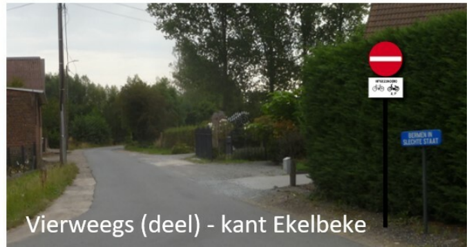
Vierweegs (deel) - kant Ekelbeke