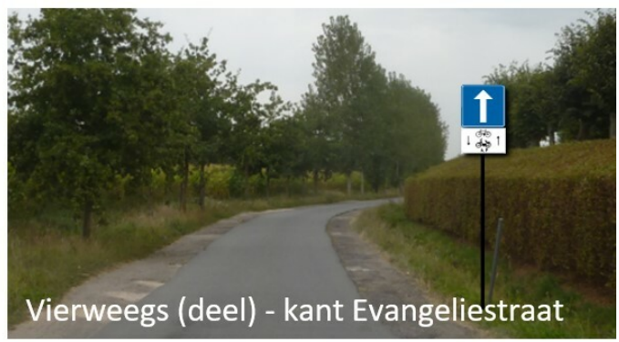
Vierweegs (deel) - kant Evangeliestraat